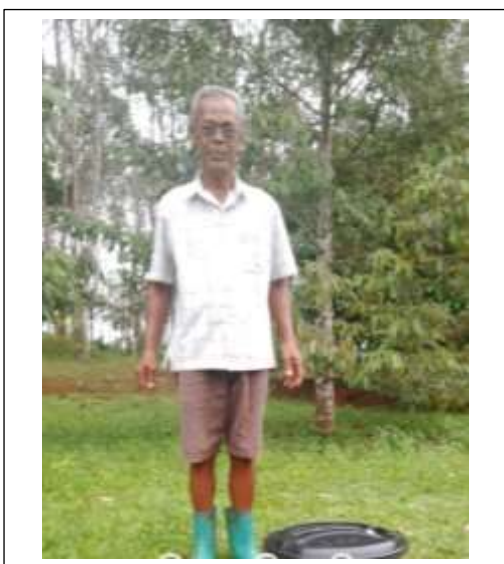
ครัวเรือนที่ ๓๗

หมู่บ้านหนองตาม หมู่ที่ ๑๐ ตำบลบาบอน อำเภอนาบอน จังหวัดนครศรีธรรมราช