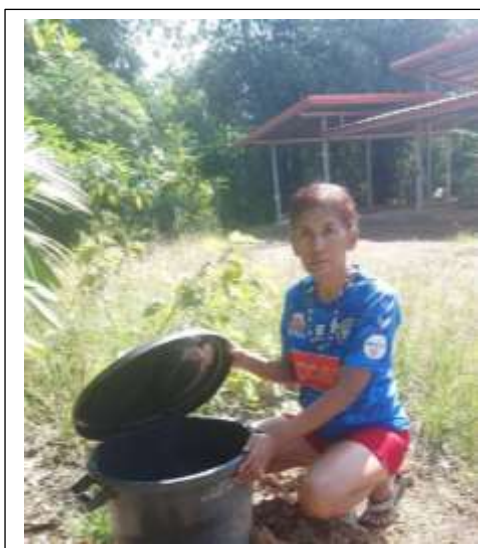
ครัวเรือนที่ ๓๘