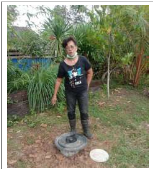
ครัวเรือนที่ ๓๔