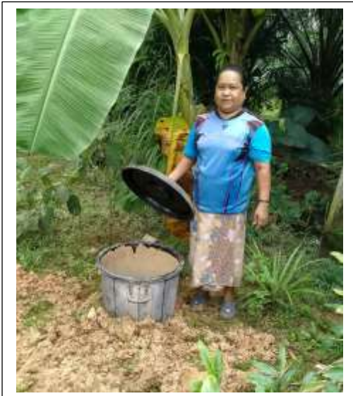
ครัวเรือนที่ ๓๓